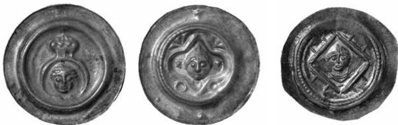
FIGUR 2–4. Tre brakteat-utgåvor av Markgreve Otto den rike i staden Meissen (Tysk-romerska riket) ca 1156–1190, där mynten drogs in varje år. \varnothing ca 26 mm.

lätta att kontrollera, till exempel städernas marknader. Historiska källor antyder att det var just städer och regioner med en begränsad erfarenhet av marknader och mynt som tillämpade periodiska myntindragningar. Dessa regioner återfanns i de centrala, norra och östra delarna av Europa (se figur 1). 23