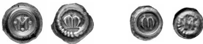
FIGUR 5–8. Fyra av Magnus Ladulås utgivna M-brakteater i Svealand (figur 5 och 6) och Götaland (figur 7 och 8). Figur 5 och 7 har slät rand, medan figur 6 och 8 har strålränd. \varnothing ca 17 mm (Svealand) och 14 mm (Götaland).

De empiriska observationer som gjorts under perioden år 1160–1290 om antalet typer per tidsperiod, skattfyndens sammansättning, myntens silverhalt och valutaområdenas storlek kan inte förkasta teorin om periodiska myntindragningar i Sverige. Observationerna är snarare konsistenta med teorin.