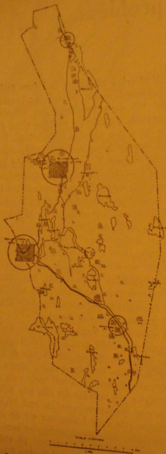
Bosättningen i Gustav Adolf vid årsskiftet 1944/45. En prick en person.