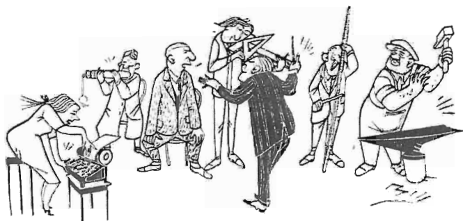
Att leda den industriella orkestern är en svår konst. Teckning ur den franska produktivitetstidskriften »Les Cahiers de la Productivité».

Utöver denna tidskrift ger RKW också ut en stencilerad skrift om fyra à fem sidor med ca tre nummer per månad, kallad RKW — Kurznachrichten . I motsats till Rationalisierung är denna publikation tillgänglig endast för RKW:s egna medlemmar. Den innehåller korta notiser om lyckad rationalisering, om konferenser,