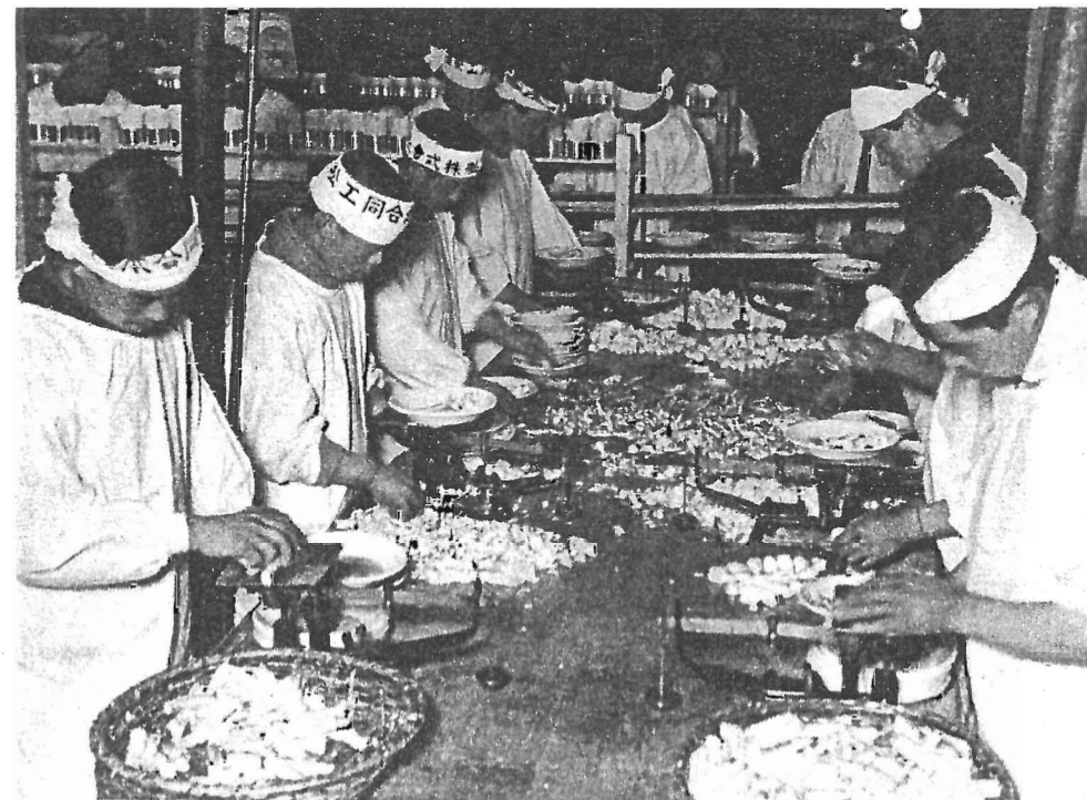
Fisken är en betydande japansk näringsgren. På bilden tas krabbfångsten om hand av arbetare inom konserverindustrin redan ombord på fartyget.

Förkrigstidens reallösnivå är nu uppnådd, ehuru det är stora differenser mellan olika industrigrenar. Annars är siffror över lönernas storlek rätt meningslösa, om de inte kombineras med uppgifter om produktiviteten, vilket tyvärr inte är möjligt. När man i Europa vill ha tullar gentemot den japanska "slavlönekonkurrensen" glöms nästan alltid en sak, nämligen Euro-