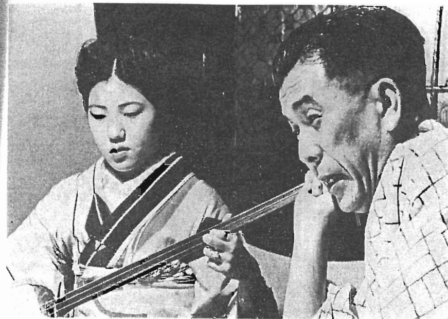
Det japanska folket har problem att brottas med, som ligger vid sidan av dem turisten och den tillfälliga besökaren kommer i kontakt med.

Vid krigsslutet reducerades Japans areal med omkring hälften. De viktigaste avträdelserna var Kurilerna, Södra Sachalin (till Sovjetunionen), Manchuriet, Formosa, Pescadorerna (till Kina) och Korea. Från