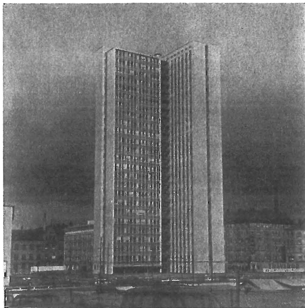
"Skatteskrapan" innehållande en del av stadens förvaltning reser sig majestätiskt över söders bebyggelse.

Vid försöken att ange den offentliga sektorns omfattning har man använt sig