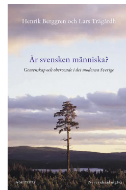
Den moderna klassikern från 2009 där begreppet statsindividualism myntades.