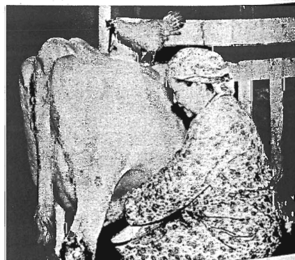
SPECIALISERINGEN är framtidens melodi. Mångsyssleriet (se idyllen ovan) viker för exempelvis hönskötsel (bilden t.h.).