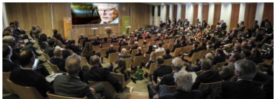
En kortfilm om IFN hade urpremiär på seminariet. Filmen kan ses på ifn.se där även hela seminariet finns arkiverat – i sin helhet som film och delvis som ett nedskrivet referat. På ifn.se finns även fler foton från evenemanget och där kan de tre böckerna som presenterades laddas ner.