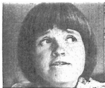
– Att vara forskare innebär egentligen att man får gå i skolan hela livet.

Under sitt arbete med avhandlingen kom hon naturligtvis in på de löneskillnader som finns mellan