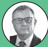
Vladimír Dlouhý, prezident Hospodářské komory ČR

Argumentace autorů článku je přesvědčivá. Po odchodu Václava Klause a Karla Schwarzenberga (tedy mužů s nesporným šarmem) z vrcholové politiky však nevím, zda současná ČR není výjimkou, neboť postrádám přitažlivější muže-politiky. Je krásnější Miroslav Kalousek než Miloš Zeman? Co se týče žen, tak snad Andrej Babiš a jeho ANO se trochu snaží, především na billboardech. Na druhé straně, z fyziognomie českého prezidenta patrně levicovost vyzorujeme.