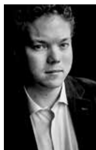
Av Johan Wennström