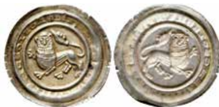
1. Ätsida och undersida av en brakteat. Braunschweig (Niedersachsen), hertig Henrik Lejonet (1142–1192). Heraldiskt lejon vänt åt vänster, 0,71 g, Ø 27 mm. Omskrift: IEPNC.LEOELDVHHINRNCSOLEOA.

Under 900-talet hade Tyskland ett relativt enhetligt myntväsende av tvåsidiga mynt med avseende på vikt och halt. Kejsaren kontrollerade myntningen och de flesta myntorter var lokaliserade i de västra delarna. Men en stark politisk decentralisering under 1000- och 1100-talen reflekterades inte minst av en kraftigt ökad delegering av mynträtt till världsliga och kyrkliga auktoriteter. Antalet myntorter mer än femdubblades från 80 (970–1000) till 414 (1197–1270). Fler orter präglade mynt med varierande myntfot (vikt, halt, diameter, plantsform). Några myntorter präglade halvbrakteater; tvåsidiga mynt som var så tunna att den ena sidans