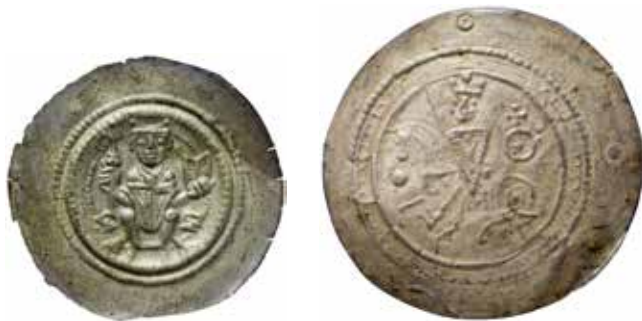
5a–b. En stor diameter möjliggjorde varierande motiv på brakteaterna.

Brakteater hindrade även silvertjuvar och förfalskningar. Under medeltiden skrapade folk bort silver från kanterna på mynten i syfte att stjäla silver. Brakteaterna var så tunna att bortskrapning riskerade att spräcka