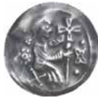
3a–b. Två tidiga brakteater från Thüringen.

3a. Pegau, fogde Wiprecht von Groitzsch (1091–1124), präglad cirka 1115/20. Bröstbild av fogden med fana på lans, 0,72 g, Ø 21 mm. Omskrift: ADDZWITOUO (retrograd).