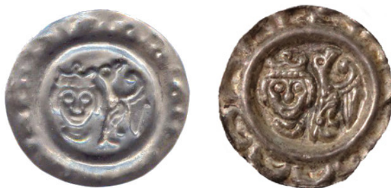
Bild 16a och 16b. Falsk och äkta brakteat från Donauwörth, Kejsare Friedrich II, 1215–50. Katalog: Steinhilber 125. Falsk: ca 23 mm och ca 1,00 g. Äkta: 23 mm och 0,83 g.