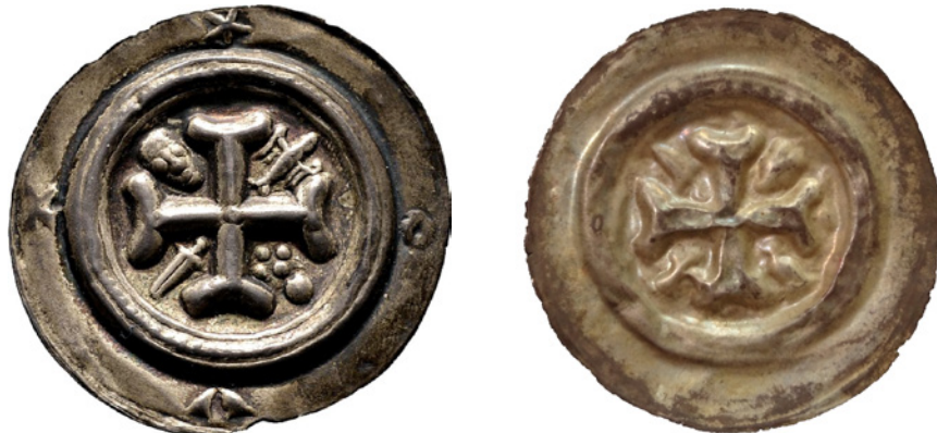
Bild 7a och 7b. Falsk och äkta brakteat från Groitzsch, Fogde Dietrich von Sommerschenburg, 1190–1207. Katalog: Posern-Klett 1154. Falsk: 36 mm och 0,91 g. Äkta: 35 mm och 0,85 g.

Bild 6a och 6b. Falsk och äkta brakteat från Magdeburg, Ärkebiskop Wichmann von Seeburg, 1152–92. Katalog: Mehl (Magdeburg) 287. Falsk: 24 mm och 0,42 g. Äkta: 22 mm och 0,87 g.