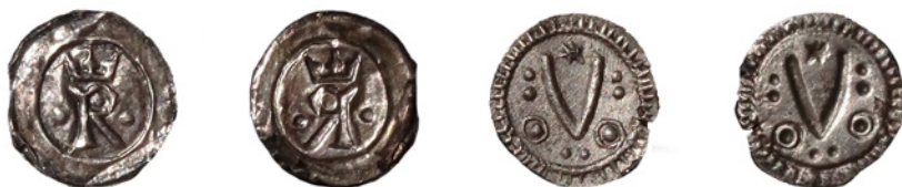
Bilder 8 och 9. Två fantasibrakteater från 1700- eller 1800-talet. Krönt R, 14 mm och 0,05 g. V omgiven av ringar och punkter, 14 mm och 0,27 g.