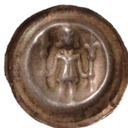
Bild 13a och 13b. Falsk och äkta brakteat från Anhalt, anonym markgreve, 1245–1300. Katalog: Thormann 338. Falsk: 21 mm och 0,42 g. Äkta: 22 mm och 0,87.