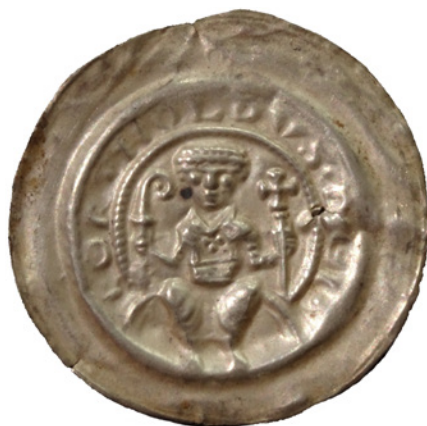
Bild 14a och 14b. Falsk och äkta brakteat från Naumburg, Biskop Berthold II, 1186–1206. Katalog: Kestner 1988. Falsk: 36 mm och 0,87 g. Äkta: 37 mm och 1,00 g.