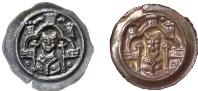
Bild 5a och 5b. Falsk och äkta brakteat från Hildesheim, Biskop Konrad II eller efterföljare, 1240–60. Katalog: Mehl (Hildesheim) 135. Falsk: 27 mm och 0,72 g. Äkta: 26 mm och 0,67 g.

Bild 4a och 4b. Falsk och äkta brakteat från Bremen, Biskop Hildbold von Wunstorf, 1258–73. Katalog: Kestner 67. Falsk: 23 mm och 0,39 g. Äkta: 19 mm och 0,57 g.