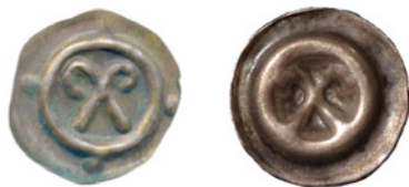
Bild 15a och 15b. Falsk och äkta brakteat från Kolberg, Biskopar av Cammin, ca 1300. Katalog: Dannenberg 101a. Falsk: Okänd diameter och vikt. Äkta: 14 mm och 0,31 g.