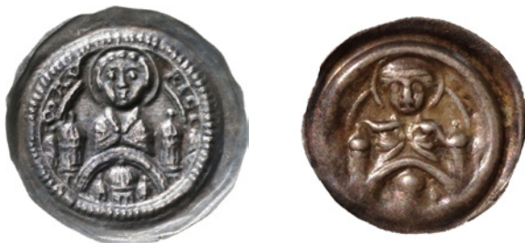
Bild 6a och 6b. Falsk och äkta brakteat från Magdeburg, Ärkebiskop Wichmann von Seeburg, 1152–92. Katalog: Mehl (Magdeburg) 287. Falsk: 24 mm och 0,42 g. Äkta: 22 mm och 0,87 g.

Bild 5a och 5b. Falsk och äkta brakteat från Hildesheim, Biskop Konrad II eller efterföljare, 1240–60. Katalog: Mehl (Hildesheim) 135. Falsk: 27 mm och 0,72 g. Äkta: 26 mm och 0,67 g.