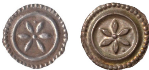
Bild 18a och 18b. Falsk och äkta brakteat från Markdorf, herrskap, ca 1250. Katalog: CC 254. Falsk: Okänd diameter och vikt. Äkta: 20 mm och 0,38 g.