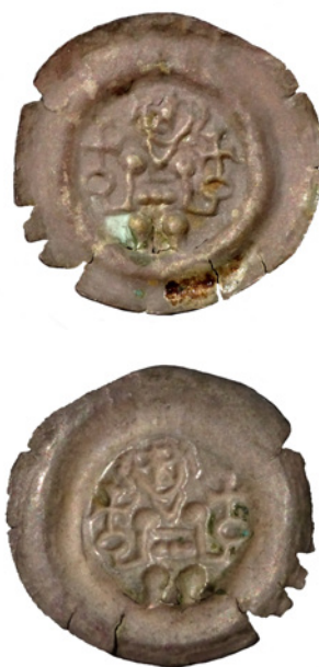
Bild 1. Starkt kopparhaltig samtida brakteatförfalskning. 24 mm och 0,41 g.

Hur de samtida förfalskningarna tog sig uttryck berodde naturligtvis på vem som präglade dem. Om förfalskningarna präglades av personal i myntsmedjan är både motivet och vikten i allmänhet korrekta men silverhalten är lägre. Om det däremot var utomstående som gjorde förfalskningarna, skiljer de sig även stilmässigt från de äkta i fråga om teknik, motiv och inskrifter (se Bild 1) (Kluge 2007:55).