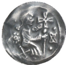
Bild 2. Brakteat från Nordhausen ca 1130–40 präglad med en positiv stamp från fransidan. 24 mm och 0,94 g.

En annan anledning till att brakteater förfalskas relativt sällan är de låga priserna på brakteater. Medeltida brakteater är nämligen ofta anonyma utan text och därmed svåra att bestämma. Det krävs betydande kunskaper för att kunna samla på dem, vilket håller priserna nere. Myntförfalskarna har därför begränsade ekonomiska incitament att koncentrera sig på brakteater. Istället hamnar fokus på värdefulla mynt från antiken eller perioden 1500–1800.