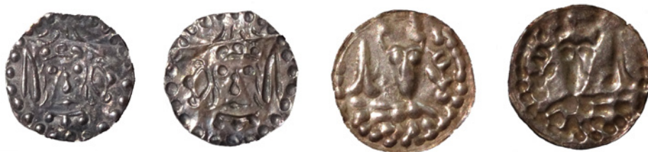
Bilder 10–12 Tre svenska brakteatförfälskningar från 1700- och 1800-talen jämförda med original.