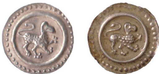
Bild 17a och 17b. Falsk och äkta brakteat från Memmingen, anonym kejsare, 1260–70. Katalog: CC 244. Falsk: Okänd diameter och vikt. Äkta: 20 mm och 0,47 g.