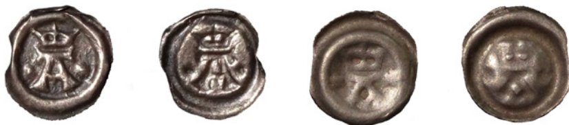
Bild 12. Falsk och äkta brakteat från Sten Sture d.ä. (1470–97, 1501–03).

Falsk: 13 mm och 0,07 g. Äkta: 14 mm och 0,10 g.