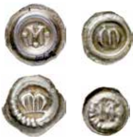
2a–d. Fyra av Magnus Ladulås utgivna M-brakteater i Svealand och Götaland, övre raden med slät ring, undre raden med strålring.

De svenska kungarna utgav flera mynttyper i både Svealand och Götaland under första hälften av 1200-talet. Tabell 1 . Brakteaterna i Svealand och Götaland har sina egna karaktäristiska stilar, men inom varje valutaområde skiljer sig typerna åt genom huvudmotivet. Som Tabell 1 visar så skiljer sig antalet typer per tidsperiod över tid och region. Årliga myntindragningar skulle till exempel ha kunnat ske under Johan Sverkersson och Knut Långe i Svealand. Under Erik Eriksson präglades fler typer i Götaland (åtta) än i Svealand (sex). Noterbart är att två utgåvor har samma motiv i båda områdena: en fågel och ett krönt huvud. Kjell Holmberg (1995) har föreslagit en kronologisk ordning av Erik Erikssons typer, vilket indikerar periodiska myntindragningar.