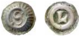
4a–b. Strålringsbrakteat och slättringsbrakteat från cirka 1354–1363 respektive 1363–1365.