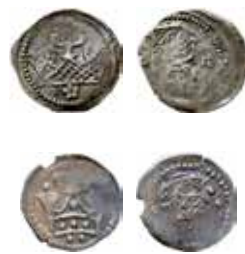
3a–b. Två av Birger Magnussons mynt med krona på ena sidan och B respektive S på den andra.

Ny analys av skattfynden under Magnus Ladulås tyder på att brakteaterna med ett M inom slät ring respektive strålring och som tidigare attribuerats till olika myntorter är kronologiska. Bild 2 . Under både Valdemar och Magnus Ladulås genomfördes troligen indragningarna med 5–6 års mellanrum.