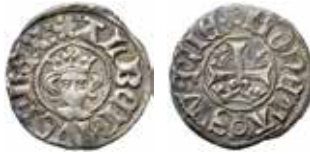
5a–c. En av Albrekt av Mecklenburgs örtugar samt två av hans krönta pennningar utgivna efter 1370 i Stockholm respektive Västerås.