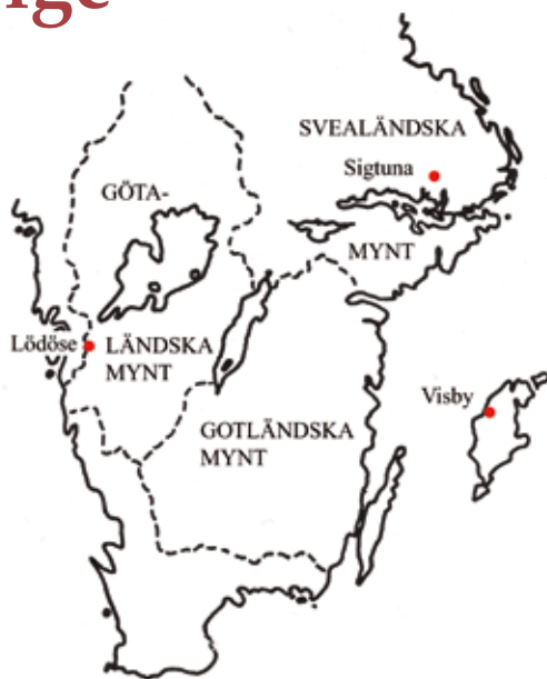
Karta 1. Valutaområden i Sverige fram till 1250. Källa: Jonsson (1995 s. 51).

respektive fyra götaländska. Precis som landskapslagarna så var mynten regionalt begränsade i Sverige – ett system som påminner om det kontinental.