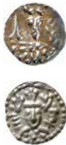
1a–b. Två av Knut Erikssons många svealändska mynttyper från cirka 1180.

Det fanns tre myntfötter och valutaområden i Sverige 1153–1250, svealändska, götaländska (västra Götaland) och gotländska penningar (Gotland och östra Götaland). Karta 1 . Gotland var i union med Sverige men hade en självständig ställning. Två svealändska penningar var värda tre gotländska