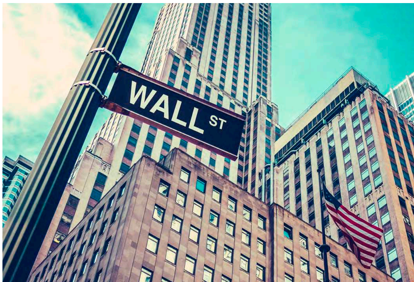
Sinnebilden för kapitalismen: Svårt att hitta positiva narrativ.