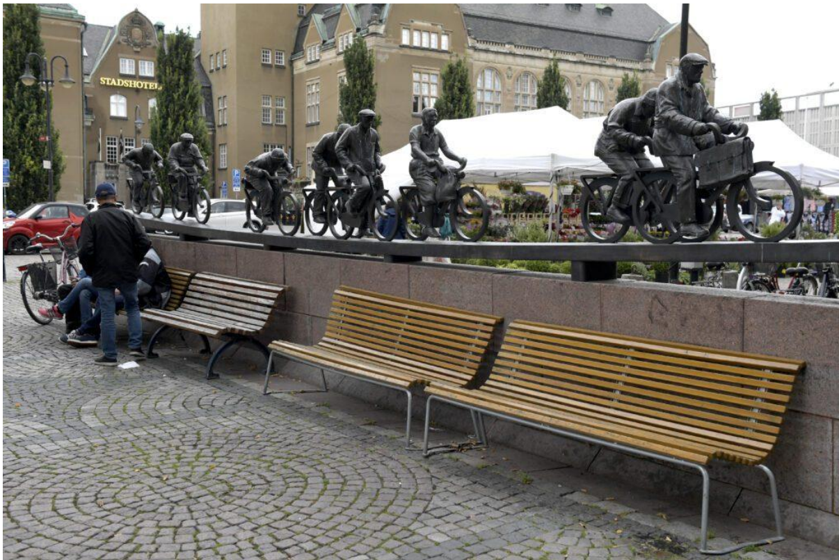
På väg till jobbet. Arbetsmoralen skildrad i konstverket "Aseströmmen" på Stora Torget i Västerås.

NIMA SANANDAJI, GABRIEL HELLER SAHLGREN 5 APRIL 2022