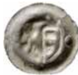
35. Kelbra, grevar, ca 1340. Penning. KELB. 0,39 g, 19 mm. Bonhoff 1238.