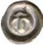
7. Hildesheim, anonym biskop, 1362–92. Penning. Gotiskt T. 0,47 g, 18 mm. Mehl 294.