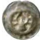
34. Ellrich, grevar av Hohnstein, 1332-82. Penning. ELRI. 0,39 g, 17 mm. PK 138.