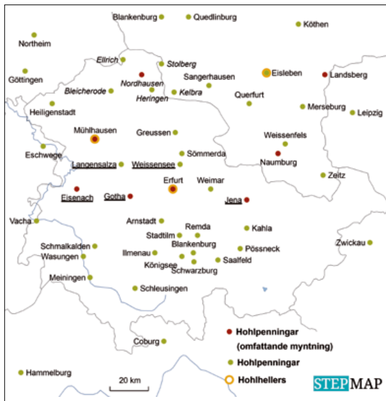
Karta 1. Myntorter i Thüringen som präglade hohlpenningar 1335–1465.

Hohlpenningarna från Thüringen kan även dateras genom att undersöka spår efter präglingstekniken på randen. Tekniken för hohlpenningarna förändrades nämligen över tiden. Från 1250-talet introducerades en