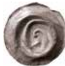
15. Göttingen, staden, 1400-talet. Penning. Gotiskt G. 0,32 g, 17 mm. Schrock 4.