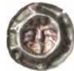
42. Schwarzburg, grevar, före 1380. Penning. 0,39 g, 18 mm. Heus 218.1.