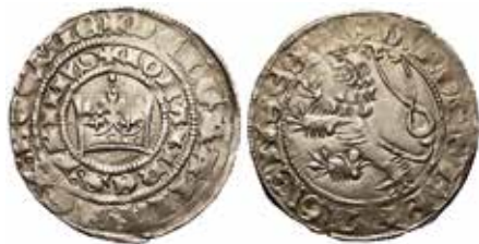
21. Prag-groschen, kung Johan von Luxemburg, 1310–46. +DEI GRATIA REX BOEMIE/IOHANNES PRIMVS) (GROSSI PRAGENSES. 3,80 g, 29 mm.)