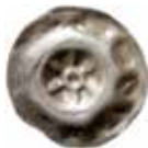
45. Erfurt, staden, 1400-talet. Penning. MARTINI. 0,32 g, 17 mm. PK 436.