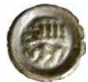
3. Braunschweig, staden, 1296–1412. Penning. 0,60 g, 20 mm. Gotiskt M ovanför lejonet. Denicke 292, Kestner 929.