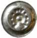
9. Hannover, staden, 1322–1437. Penning. 0,58 g, 18 mm. Welter 278g.