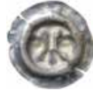
39. Arnstadt, grevar av Schwarzburg, 1350-60. Penning. ARNST. 0,36 g, 17 mm. PK 90.