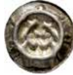
33. Langensalza, staden, efter 1380. Penning. +SALCZA. 0,33 g, 18 mm. PK -.