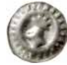
19. Frankfurt an der Oder, markis Joachim I, 1499–1535. Penning. 0,30 g, 16 mm. Bahrfeldt II:77.