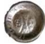
40. Saalfeld, staden, 1400-44. Penning. +SALWELT. 0,40 g, 18 mm. PK 759.