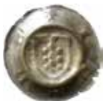
31. Jena, staden, ca 1450. Penning. +IHENE. 0,40 g, 18 mm. PK 578.