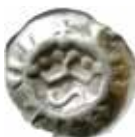
48. Schmalkalden, grevar av Henneberg, efter 1431. Penning. +SMELKEL. 0,37 g, 17 mm. PK 793.