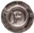
28. Eisenach, lantgreve Friedrich II, 1323-49. Penning. Gotiskt F, ISENA. 0,38 g, 18 mm. PK 110.