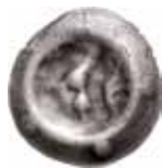
50. Kassel, lantgreve Ludwig I, 1413–58. Penning. 0,33 g, 18 mm. Schütz 293.