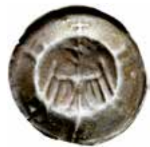
24. Nordhausen, stadspprägling, ca 1450. ÖRN. NORTH. 0,41 g, 18 mm.