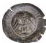
37. Mühlhausen, staden, 1400-talet. Penning. +MOLHV. 0,46 g, 18 mm. PK 635.