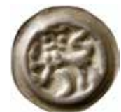
4. Braunschweig, staden, 1296–1412. Penning. 0,47 g, 20 mm. Denicke 336, Kestner 985.