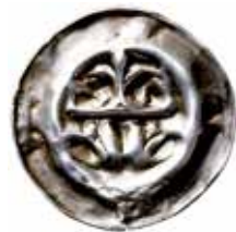
23. Nordhausen, stadspprägling, 1350–60. Krona över två örnar. NORT. 0,39 g, 18 mm.