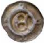
26. Gotha, staden, före 1360. Penning. Gotiskt E, GOTÄ. 0,40 g, 19 mm. PK 508.