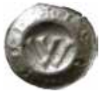
29. Eisenach, lantgreve Wilhelm III, 1444-65. Penning. Gotiskt W, +ISENAoh. 0,31 g, 17 mm. PK 127.