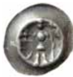
52. Magdeburg, ärkebiskop Albrecht III von Querfurt, 1382–1402. Penning. 0,40 g, 19 mm. Kestner 1606.