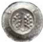
30. Jena, staden, 1405-48. Penning. +IHENE. 0,35 g, 18 mm. PK 581.