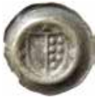
8. Hildesheim, domkapitel, 1435–1500. Penning. 0,36 g, 18 mm. Mehl 313.