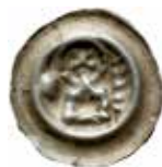
53. Halberstadt, staden och domkapitel, 1363–1520. Penning. 0,40 g, 18 mm. BBB 29.03.