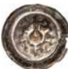
49. Eschwege, lantgreve Heinrich II, 1328–76. Penning. 0,35 g, 18 mm. Schütz 227.