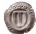
43. Landsberg, kurfurste Friedrich II och hertig Wilhelm III, 1428-64. Penning. +LAND. 0,41 g, 18 mm. Haupt 49:21.