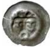
11. Goslar, staden, efter 1290. Penning. 0,38 g, 19 mm. BBK 1h.