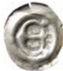
14. Einbeck, staden, 1400-talet. Penning. Gotiskt E. 0,37 g, 17 mm. Buck 1a.