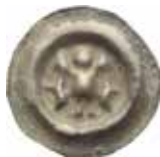
51. Magdeburg, anonym ärkebiskop, 1350–1400. Penning. 0,50 g, 20 mm. Mehl 861.