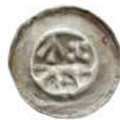
1. Braunschweig, staden, 1296–1412. Penning. 0,50 g, 21 mm. Denicke 269, Kestner 881.

Regionen Brandenburg slutade med brakteater omkring 1250. Därefter präglades tvåsidiga mynt med valören en penning. Under 1400-talet präglades hohlpenningar som påminner om dem från Hansans städer i norra Tyskland. De har för det mesta strålrand, men även glatt rand förekommer. Hohlpenningarna har en vikt på 0,25–0,40 gram och en diameter på 15–17 mm. Även nomina-