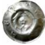
32. Weissensee, staden, efter 1381. Penning. +WISSEN. 0,35 g, 18 mm. PK 862.