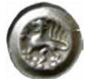
5. Braunschweig, staden, efter 1412. Penning. 0,53 g, 20 mm. Denicke 343, Kestner 993.