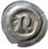
6. Hildesheim, anonym biskop, 1362–92. Penning. Gotiskt N. 0,39 g, 20 mm. Mehl 287.