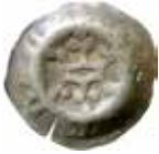
27. Gotha, staden, efter 1381. Penning. +GOTHA. 0,42 g, 18 mm. PK 516.