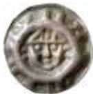
44. Erfurt, ärkebiskop Heinrich III von Virneburg, 1328–46. Penning. MARTINV. 0,43 g, 17 mm. PK 401.