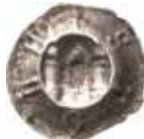
36. Stolberg, staden, 1403-55. Penning. +STOLB. 0,29 g, 18 mm. PK 812.