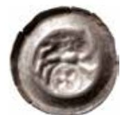
2. Braunschweig, staden, 1296–1412. Penning. 0,63 g, 21 mm. Denicke 285, Kestner 913.