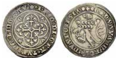
22. Meissen-groschen. Freiberg, markis Friedrich II, 1323–49. Präglad ca 1338. +FRID DI GRA TVRING LMGRAV) (+GROSSVS MARCH MYSNENSIS. 3,56 g, 25 mm.)

kappa som övre präglingens verktyg när brakteater präglades (se vänster del av Bild 25). Kappan har ett koniskt hålrum som inte är så djupt där man bäddar in ett mjukt material som läder eller bly. Kappan kommer att omsluta hela plantsen. Konsekvensen blir att det mjuka underlaget inte längre rör sig i sidled vid präglingen och man undviker att brakteatern blir svagpräglade i kanterna. En annan effekt är att ytterkanterna på brakteaten blir rundade vänt mot åtsidan.