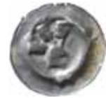
41. Querfurt, borggrevar, 1300-talet. Penning. 0,34 g, 18 mm. Tornau 191.