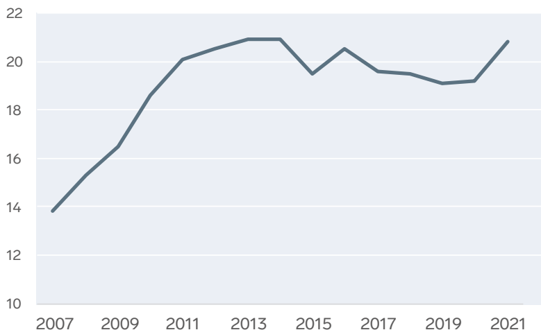
Figur 2. Andel personer 65 år och äldre på särskilt boende i enskild regi, procent.