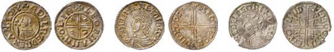
Bild 1:1–3. England, Æthelred II (978–1016). Diameter cirka 23 mm.

1. Crux , Lincoln, cirka 991–997, 1,37 g.