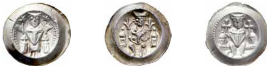
Bild 2:1–3. Endast myntbilden förändras vid periodiska indragningar. Tre brakteater från myntorten Hildesheim (i Niedersachsen), biskop Konrad II eller efterföljare (1240–1260). Vikt och diameter: 1. 0,69 g, diam 26 mm; 2. 0,70 g, diam 26 mm; 3. 0,79 g, diam 27 mm.