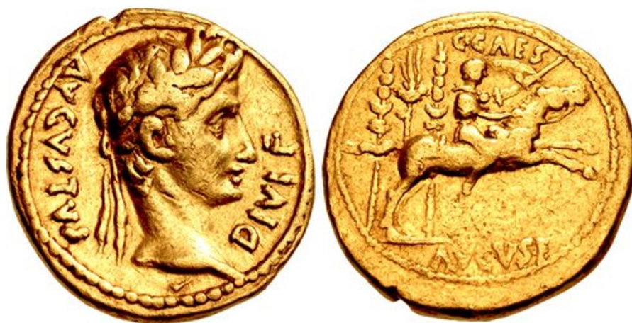
Aureus utgiven av kejsare Augustus (27 f.Kr.–14 e.Kr.) i Lyon, 20 mm och 7,9 g.

Det fanns även andra institutioner som underlättade effektiviteten. Det latinska språket var gemensamt. Med undantag för grekiskan som hade en särställning i de östra delarna, infördes latin som huvudspråk var romarna än expanderade. Men än viktigare var den gemensamma valutan som sänkte transaktionskostnaderna och skapade stabilitet i handeln. Guldmyntet aureus (25 denarer) och silvermyntet denaren fungerade som internationella valutor. Det fanns betydligt större myntvolym och fler valörer i Romarriket än under medeltiden. Detta antyder att den monetära ekonomin var djupt rotad i många samhällsgrupper. Men framför allt är det ett bevis på att arbetsdelningen var långt fortskriden. Det är nämligen specialiserade yrken som skapar efterfrågan på mynt som betalningsmedel och värdemätare.